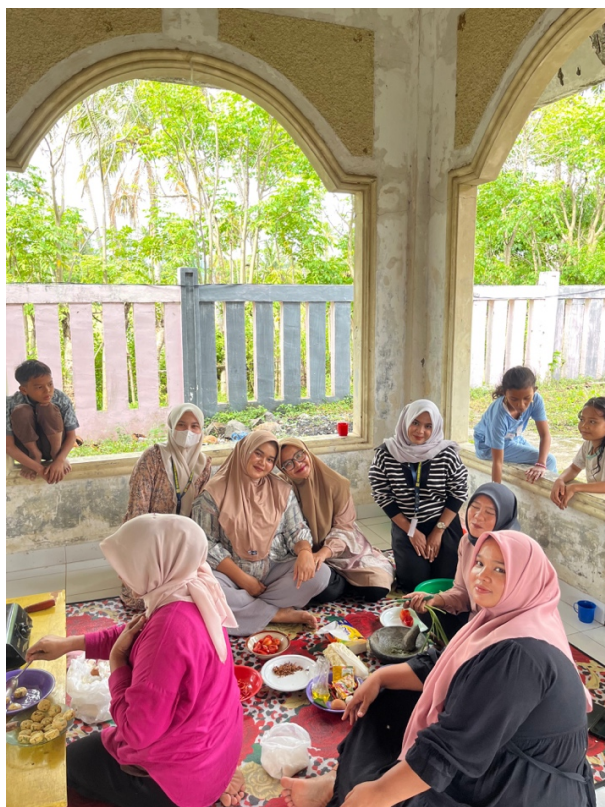
Gambar 2. Kelompok II sedang menggoreng perkedel berbahan dasar tempe.