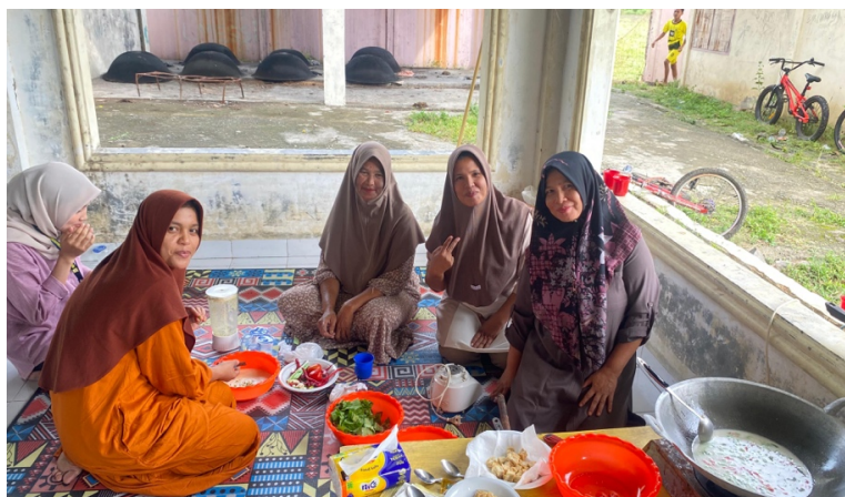
Gambar 1. Persiapan lomba masak kelompok I